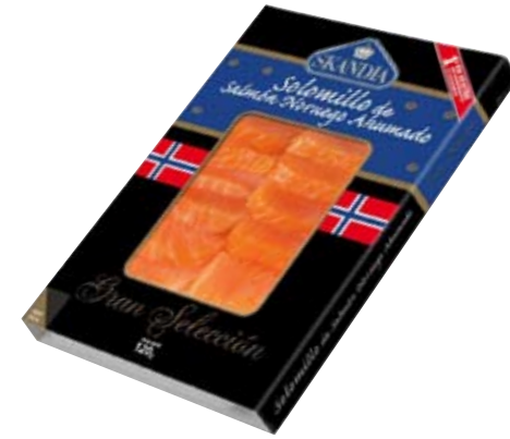
SKANDIA salmón Solomillos gran selección. 100 g.