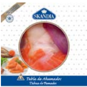
SKANDIA Tabla de ahumados. 140 g.