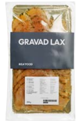
GRAVAD LAX salmón Marinado. 200 g.