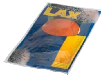
SALAR LAX salmón Ahumado. 200 g.