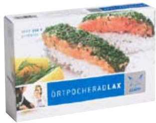
ÖRTOCHERD LAX salmón A las finas hierbas. 260 g.