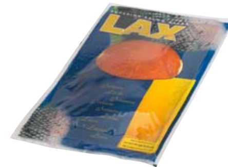
SALAR LAX salmón Ahumado. 400 g.