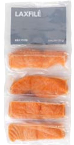
LAXFILÉ salmón Centros para hornear. 125 g.